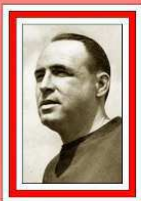
KARL RAPPAN (TÉCNICO)