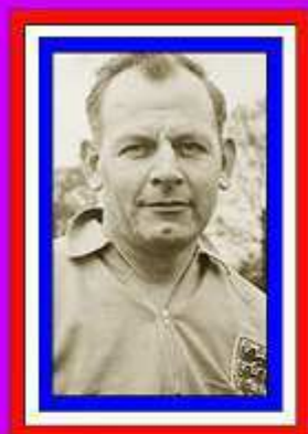
WALTER WINTERBOTTOM (TÉCNICO)