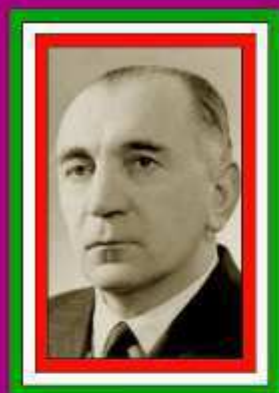
GUSZTAV SEBES (TÉCNICO)