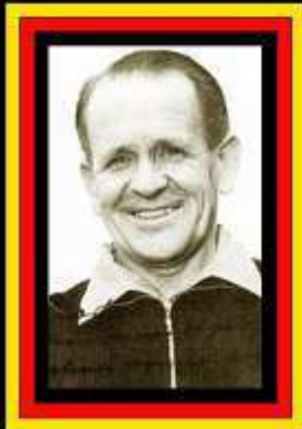
SEPP HERBERGER (TÉCNICO)